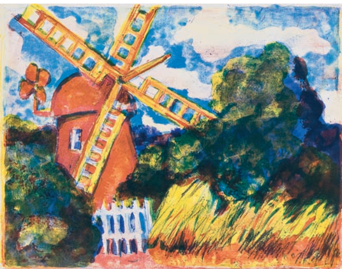
Ernst Leonhardt Rote Mühle Bildformat: 38 x 48 cm € 198,- (Nichtmitglieder € 248,-) NR 04343-7

1935 in Berlin geboren, dort auch Studium an der Meisterschule für das Kunsthandwerk. Seit 1958 freischaffender Künstler. 1984 Gastprofessur an der Hochschule der Künste Berlin. 1997 ARAG-Kunstpreis. Ernst Leonhardt lebt und arbeitet in Berlin. Leonhardt ist inzwischen der meistverkaufte Künstler des Buchergilde artclub, nicht zuletzt wegen seiner wirklichen Meisterschaft in der Farblithographie, die den ganzen Reiz dieser diffizilen Technik zur Entfaltung zu bringen vermag.