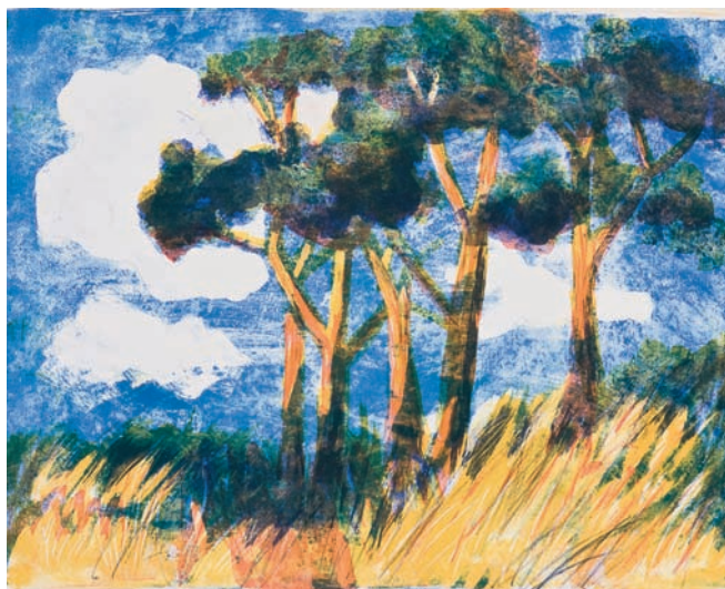
Ernst Leonhardt Föhren am Hang Bildformat: 38 x 48 cm € 198,- (Nichtmitglieder € 248,-) NR 04344-5

Lithografien von je 4 Steinen Tabor Presse Berlin Papierformat: je 50 x 65 cm Auflage: je 40 Exemplare Signiert und nummeriert