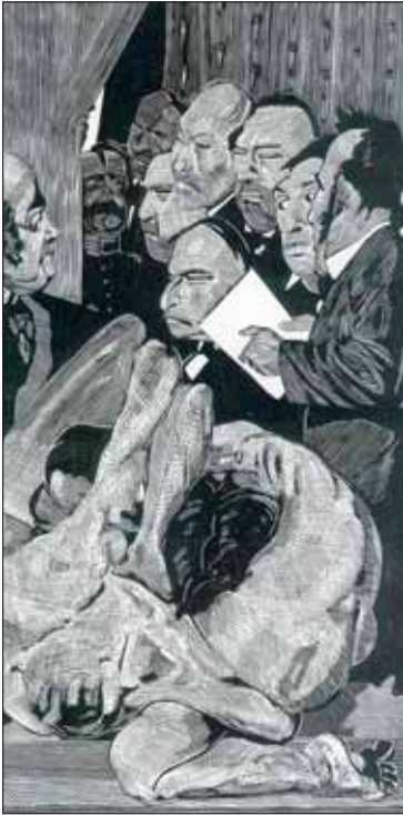
Johannes Grützke – Paulskirche Volksvertreter beim preußischen König

Der 1937 in Berlin geborene Künstler, der in den 60er-Jahren in Berlin die „Schule der neuen Prächtigkeit“ begründet hat, ist einer der bedeutendsten deutschen Künstler überhaupt. Sein vielleicht bekanntestes Werk ist die großartige und doch gänzlich unpathetische malerische Ausgestaltung der Rotunde in der Frankfurter Paulskirche. Parallel zur Entstehung dieses monumentalen malerischen Werkes schuf Grützke 1990 eine Serie von 10 Linolschnitten, mit denen er die Motive seiner Malerei nunmehr in schwarzweiß überprüfte. Wir haben einige wenige Exemplare aus dieser historischen Serie zum Original-Preis von 1990 – und es gibt sogar noch 5 komplette Serien!