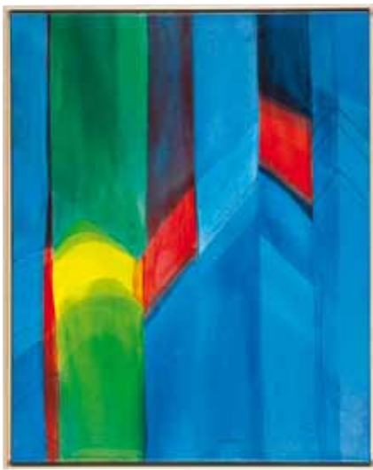
unten rechts: Willibrord Haas Aufstieg 3 Öl auf Leinwand Format: 80 x 60 cm, signiert In Schattenfugenrahmen € 2.400,- (Nichtmitglieder € 2.700,-) NR 047300

Vom 4.4. bis 30.6.13 ist eine Ausstellung mit Arbeiten von Willibrord Haas und Helga Haas-Wirth in der Büchergilde Buchhandlung Berlin, Kleiststraße zu sehen.