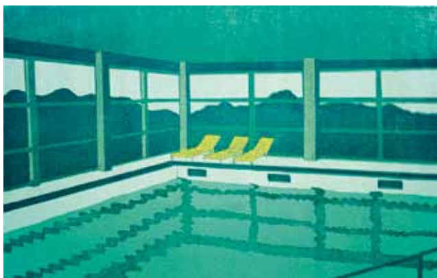
Franziska Neubert – Schwimmbad Farblinolschnitt Papierformat: 50 x 70 cm, Bildformat: 30 x 42 cm Auflage: 8 Exemplare, signiert und nummeriert € 230,- (Nichtmitglieder € 278,-) NR 04736X

Die junge Leipziger Künstlerin (*1977) studierte von 1996 bis 2002 an der HGB bei Volker Pfüller und Thomas M. Müller. Nach ihrem Diplom im Jahr 2002 erhielt sie ein einjähriges Stipendium des DAAD und studierte an der Ecole Nationale des Arts décoratifs Paris. Für die Büchergilde schuf sie eine Reihe freier Grafiken, das Tolle Heft zum Text von Julio Cortázar und vor allem die Illustration zu Joseph Roth Das Spinnennetz , das von der Stiftung Buchkunst als eines der Schönsten Bücher 2010 ausgezeichnet wurde. Ihre modern-lakoniische Bildsprache wirkt auf den Betrachter ähnlich ambivalent wie z. B. die Bilder von Edward Hopper.