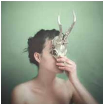
Horse and I, Vorzugsausgabe 2 Mit einer Orig.-Fotografie (C-Print) Format: 17,5 x 17,5 cm, Auflage: 10 Exemplare Signiert und nummeriert, € 168,- (Nichtmitglieder € 198,-) NR 047327