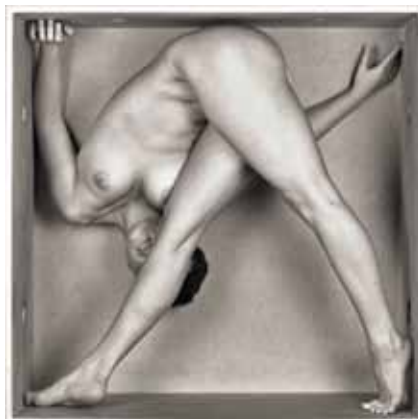
The Box, Vorzugsausgabe 1 Mit einer Orig.-Schwarzweiß-Fotografie (C-Print) Format: 20,5 x 20,5 cm, Auflage: 30 Exemplare Signiert und nummeriert € 198,- (Nichtmitglieder € 228,-) NR 047343