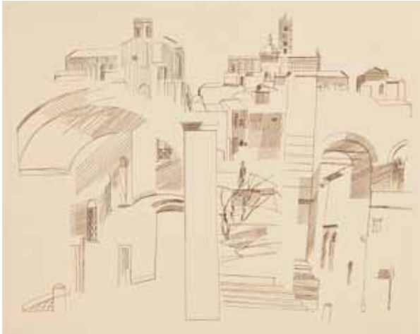
Otto Rohse Siena, San Domenico und Dom Kupferstich, Bildformat: 43 x 36 cm, Büttenformat: 65 x 50 cm Auflage: 20 Exemplare, signiert und nummeriert € 98,- (Nur für Mitglieder, nur dieses Quartal) NR 047238

Vor genau 50 Jahren erschien Dylans erste Platte und Rohses erster Pressendruck in der eigenen Presse. Otto Rohse, 1925 in Insterburg/Ostproußen geboren, Schüler des großen Buchgestalters Richard von Sichowsky, hat die westdeutsche Buchkunst in der zweiten Hälfte des 20. Jahrhunderts nachhaltig geprägt und gilt heute als einer der profiliertesten Vertreter der klassischen Typographie und Buchillustration. Er ist daneben einer der ganz wenigen zeitgenössischen deutschen Kupferstecher von Rang, sein Werk ist komplett im Germanischen Nationalmuseum Nürnberg zu sehen. Rohse lebt seit 1948 in Hamburg. Aus Anlass des Jubiläums gibt es ein besonderes Angebot der Büchergilde: