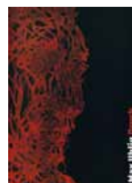
Vorzugsausgabe Max Uhlig – Druck 152 Seiten, Format: 30 x 23 cm, Festeinband Vorzugsausgabe mit der Original-Radierung: Kopf Käthe Kollwitz Bildformat: 27 x 21 cm, Auflage: 60 Exemplare Signiert und nummeriert € 190,- NR 047203