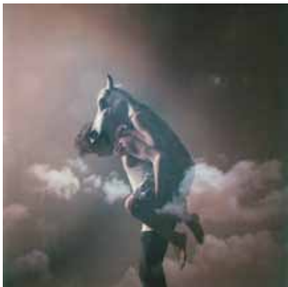
Horse and I, Vorzugsausgabe 1 Mit einer Orig.-Fotografie (C-Print) Format: 17,5 x 17,5 cm, Auflage: 10 Exemplare Signiert und nummeriert, € 168,- (Nichtmitglieder € 198,-) NR 047335